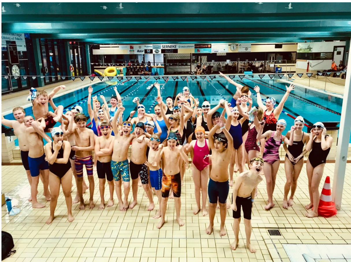
DualMeet mot Uddevalla under ett hemmaläger för Kungälvs yngre simmare

Genomfördes i enlighet med traditionen. Det var en god spridning mellan grupperna med mycket aktivitet och teambuilding. Simmarna fick upp konditionen bra efter veckan samt en bra grund i tekniksimmningen inför säsongen. Bunkergames genomfördes, lyckat som alltid.