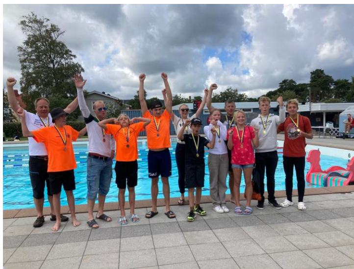
Representanter för Sveriges främsta hindersimklubb – Kungälvs Simsällskap